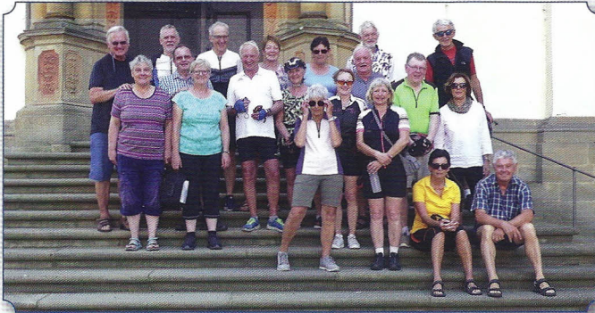
Radtour auf dem Kocher-Jagst Radweg vom 23.06. bis 28.06. 2019. Gruppenfoto vor dem Kloster Schöntal.